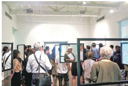
海外メディア芸術祭等参加事業(平成28年度) 「Landscapes: New vision through multiple windows」 ジャパン・クリエイティブ・センター(シンガポール)