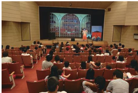
文化庁メディア芸術祭広島展「*Hiroshima * Media Arts」(平成28年度)

文化庁メディア芸術祭での受賞は、海外のフェスティバルへの出展や創作活動の支援等、関連事業を通じた新たな活動にもつながります。「文化庁メディア芸術祭地方展」では、受賞作品を中心に優れたメディア芸術作品を国内各地で展示・上映し、「海外メディア芸術祭等参加事業」では、海外のメディア芸術関連のフェスティバル等で受賞作品等を紹介します。また「メディア芸術クリエイター育成支援事業」では、文化庁メディア芸術祭において受賞もしくは審査委員会推薦作品に選ばれた若手クリエイターを対象とし、新しい作品の企画を募り、制作費の支援や専門家によるアドバイスの提供等、創作活動を支援するとともに、海外の優れたクリエイターを招へいし国際交流を推進します。