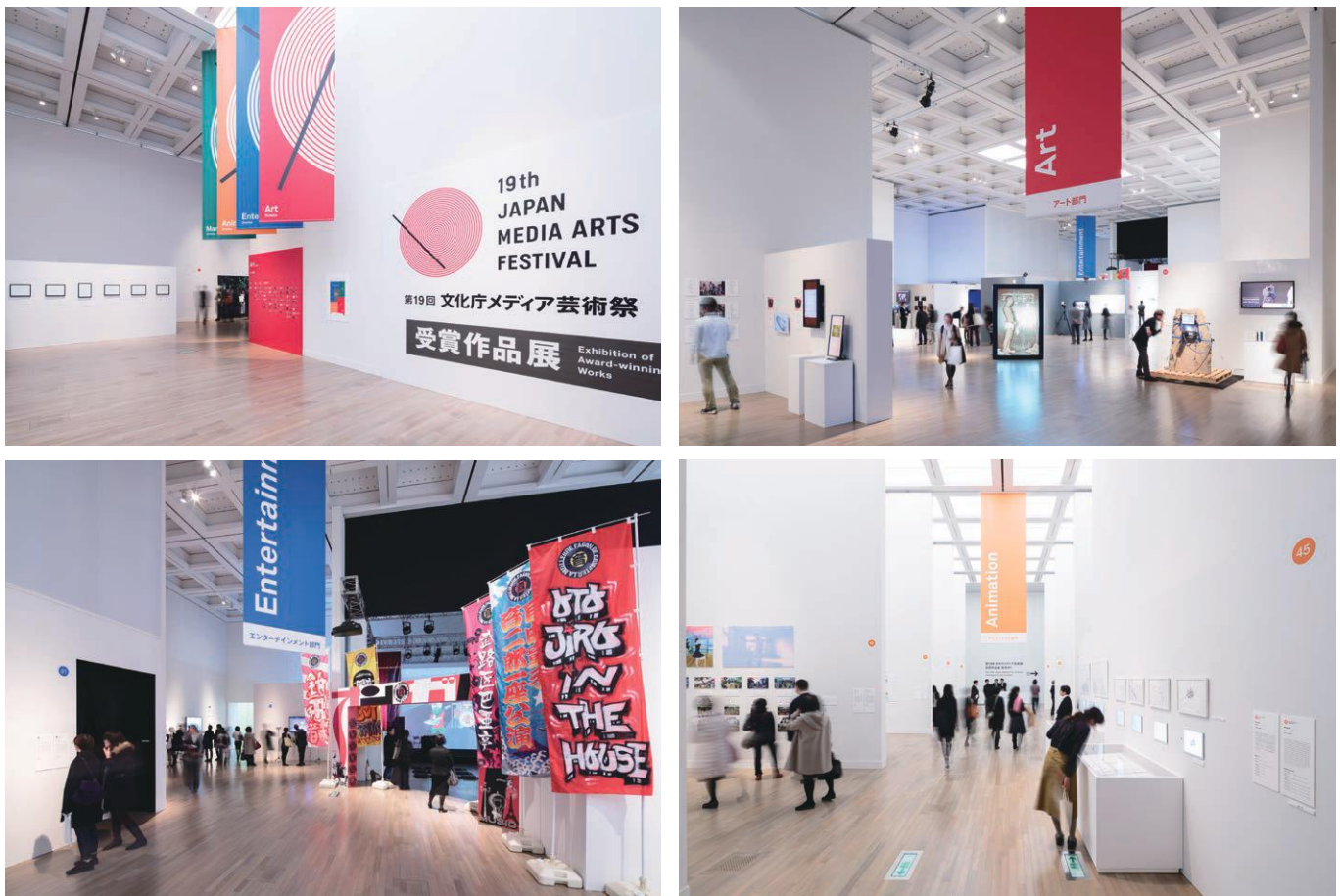
第19回文化庁メディア芸術祭受賞作品展の様子(平成27年度)