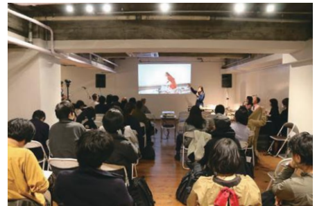
メディア芸術クリエイター育成支援事業(平成28年度)