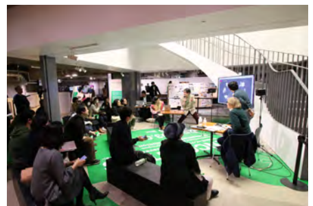
平成30年度メディア芸術クリエイター育成支援事業