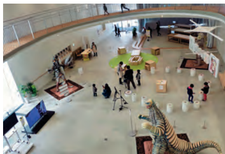
文化庁メディア芸術祭須賀川展「創造のライン、生のライン」 (平成30年度)