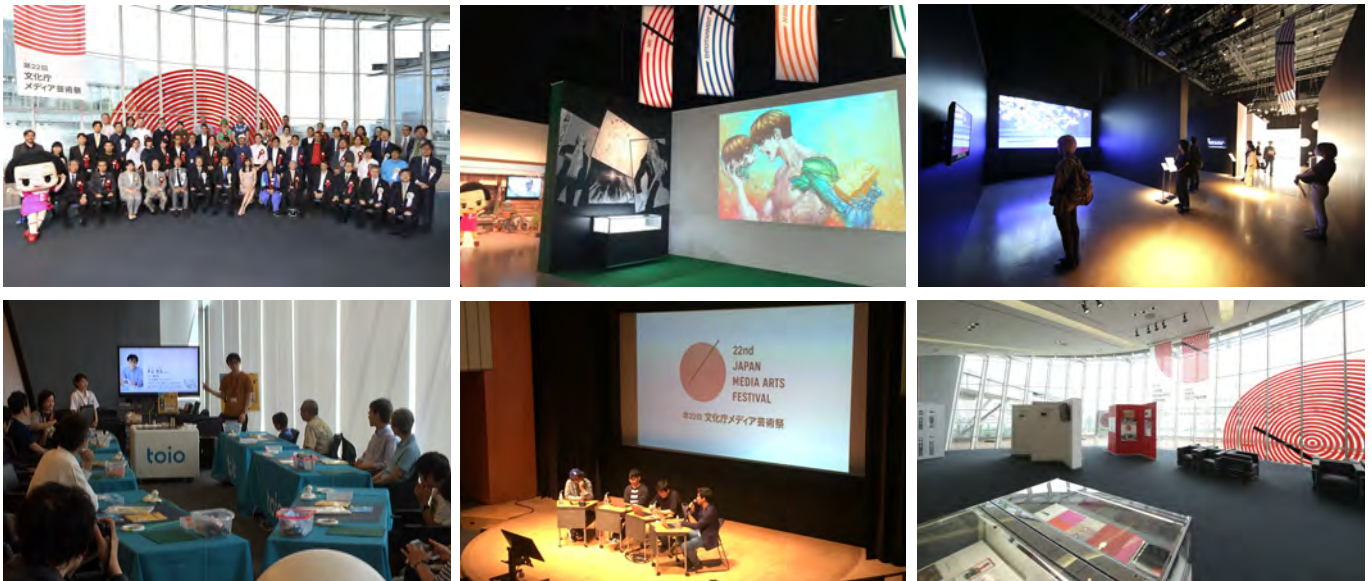
第22回文化庁メディア芸術祭 受賞作品展の様子