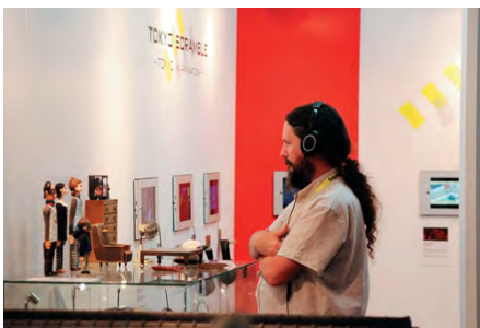
アムシー国際アニメーション映画祭2018 企画展

また「メディア芸術クリエイター育成支援事業」では、文化庁メディア芸術祭において受賞もしくは審査委員会推薦作品に選ばれた若手クリエイターを対象とし、新しい作品の企画を募り、制作費の支援や専門家によるアドバイスの提供等、創作活動を支援するとともに、海外の優れたクリエイターを招へいし国際交流を推進します。